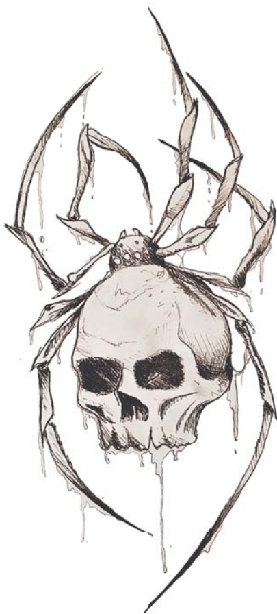
Ilustrace: Vendula Drastichová

Boj nebo útek, dva pradávné imperativy. Přidala bych k nim schopnost mimikry, na chvíli se před svými strachy zamaskovat do bezpečí, jen tak je pozorovat, ani před nimi neutíkat, ani s nimi nebojovat, jen je tak mít s vědomím toho, jak moc... anebo málo... nás vlastně definují.