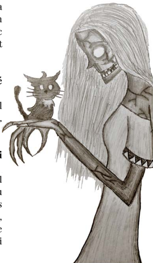
Ilustrace: Vendula Mikulová

Černá kočka přes cestu mě spolehlivě zpomalí.